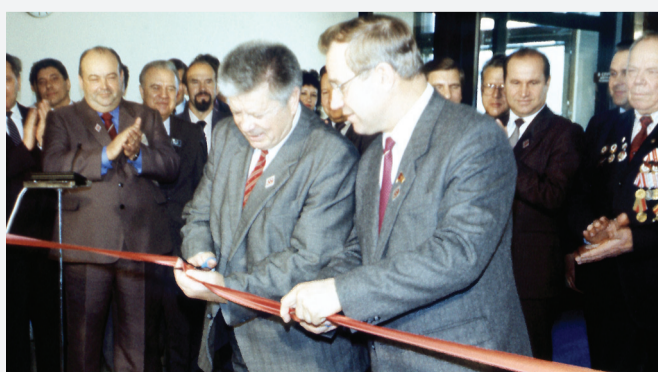
Святослав Николаевич Федоров (слева) на открытии Оренбургского филиала ФГАУ «НМИЦ «МНТК «Микрохирургия глаза».

К наиболее ярким достижениям С. Н. Федорова в развитии офтальмологии относятся: лечение катаракты и использование искусственного хрусталика; освоение хирургии стекловидного тела и сетчатки, хирургии роговицы, рефракционной хирургии; применение эксимерных лазеров.